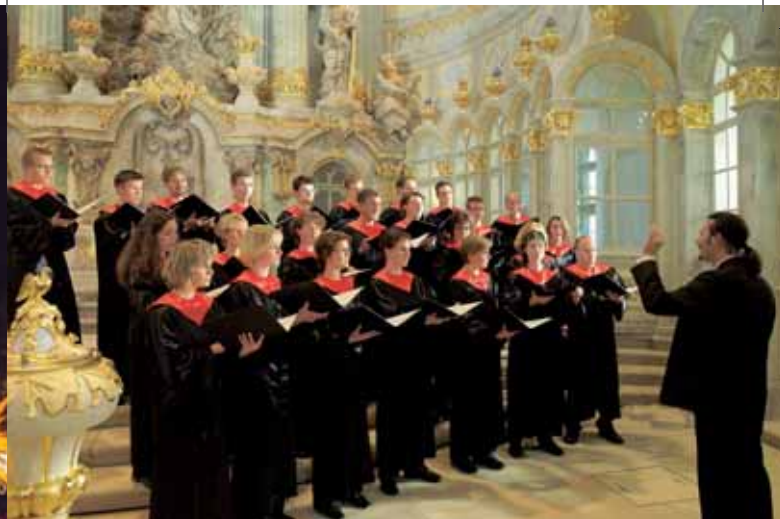
Weihnachtskonzert in der Frauenkirche