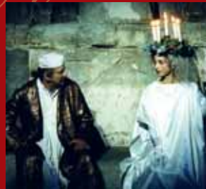
Staatsschauspiel Dresden „A Christmas Carol“