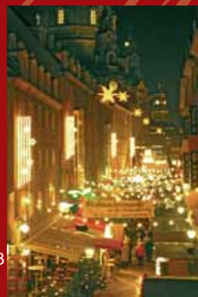
Weihnachtsmarkt an der Frauenkirche

Eine ganze Weihnachtsmeile zieht sich vom Weihnachtsmarkt auf der Prager Straße bis zur anderen Elbseite zum Weihnachtsmarkt auf der Hauptstraße und zum Neustädter Advent, wo auf festlich illuminierten Straßen des Barockviertels rund um Hauptstraße, Königstraße und Gründerzeitviertel Äußere Neustadt ein vorweihnachtliches Flair zum Flanieren einlädt.