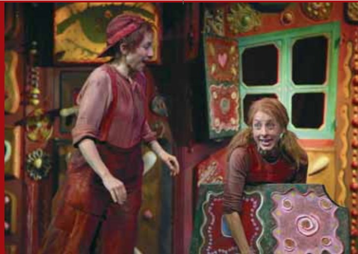
Staatsoperette Dresden „Hänsel und Gretel“

Eine Weihnachtsgeschichte Ballett nach Charles Dickens 2. und 15.12.2009, 10 Uhr 6.12.2009, 11 Uhr 22.12.2009, 18 Uhr 27.12.2009, 17 Uhr