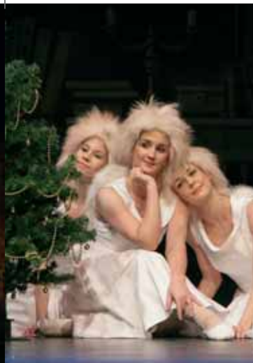
Landesbühnen Sachsen „Eine Weihnachtsgeschichte“