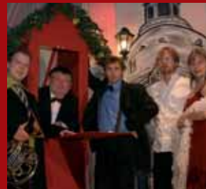
Dresdner Kabarett Breschke & Schuch

Theaterkahn Dresdner Brett! Terrassenufer/Augustusbrücke www.theaterkahn-dresden.de