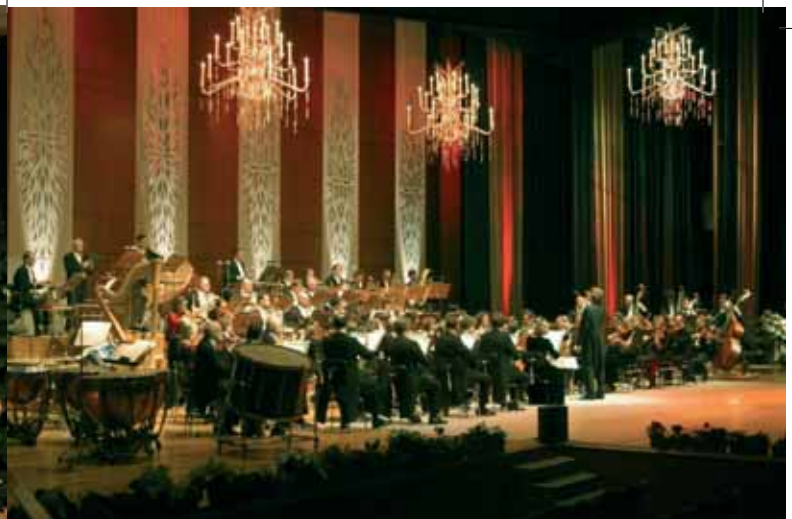
Dresdner Philharmonie Kulturpalast

Dresdner Zwinger , Marmorsaal www.dresden-theater.de