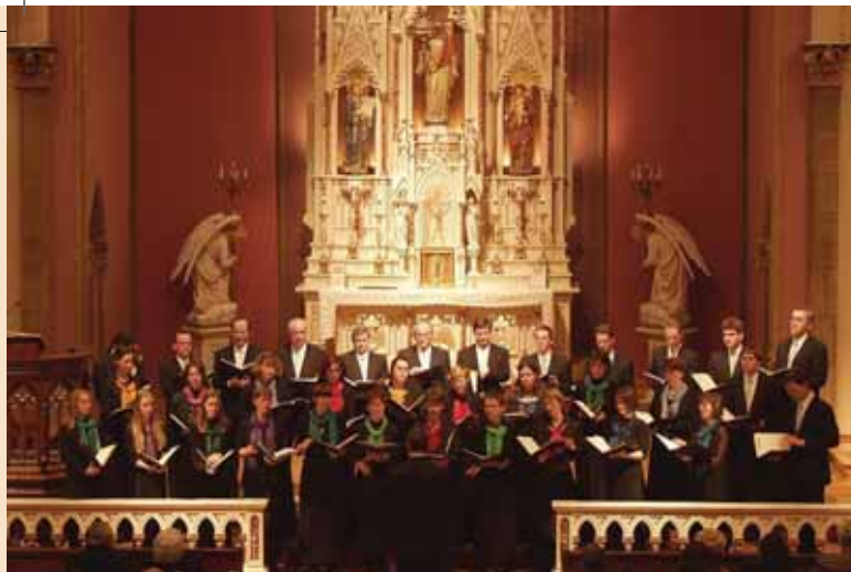
Weihnachtskonzert in der Lukaskirche