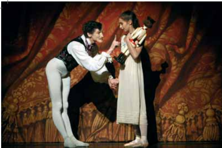
Semperoper Dresden „Der Nussknacker“