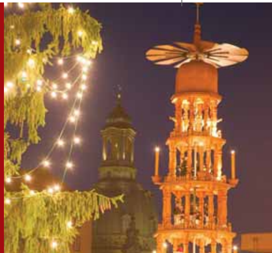
Pyramide auf dem Striezelmarkt

Stallhof am Dresdner Schloss (Termin noch nicht bekannt)