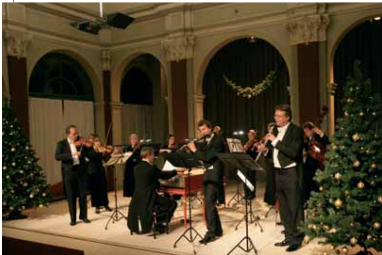
Weihnachtskonzert im Zwinger