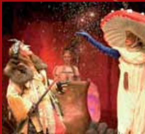
Komödie Dresden „Die Hexe Baba Jaga“

staltet, wird sicher Vergnügen bei der Operette von Johann Strauß „Die Fledermaus“ finden.