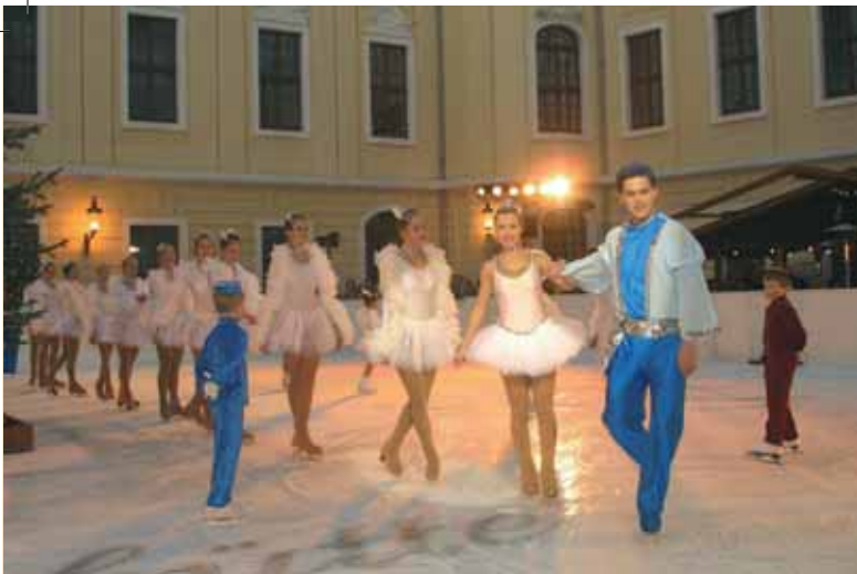
Eisbahn im Innenhof des Kempinski Hotel

Museum für Sächsische Volkkunst, Jägerhof Köpckestraße 1 Advent und Weihnachten im Jägerhof 2009 „20 Jahre danach“ Spielzeug aus der DDR 28.11.2009 – 21.2.2010