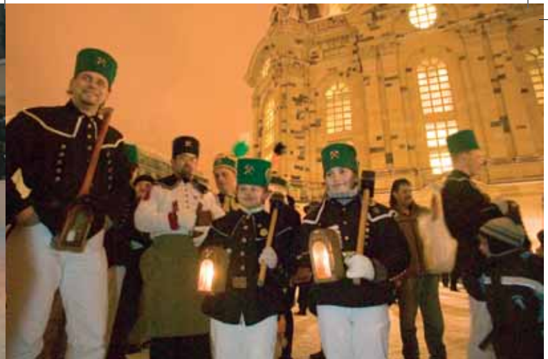
Vor der Frauenkirche