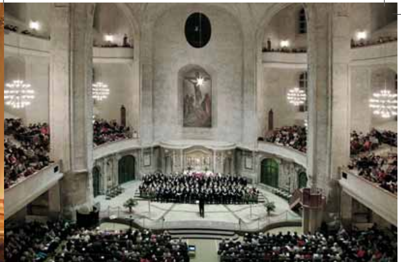
Adventsvesper in der Kreuzkirche

Frauenkirche , Neumarkt www.frauenkirche-dresden.de