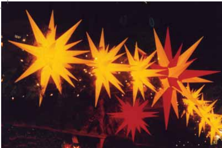
Herrnhuter Sterne auf der Münzgasse

In diesem Jahr wird Dresden durch einen neuen Weihnachtsmarkt bereichert.