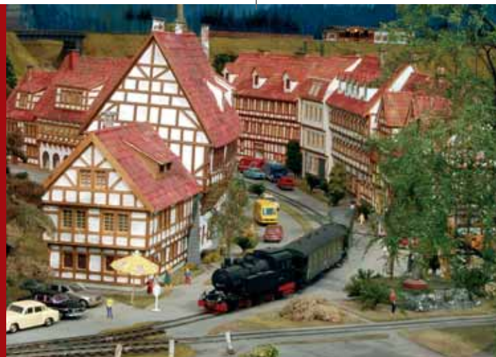
Verkehrsmuseum Dresden Modelleisenbahnanlage Spur o

„Mein schönstes Weihnachtsgeschenk – gestern und heute“ 27.11. – 30.12.2009 täglich 10 bis 20 Uhr