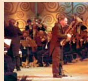
Dresdner Philharmonie Neujahrskonzert

Dresdner Bläserweihnacht Virtuose Bläsermusik zu Weihnachten aus vier Jahrhunderten 28.12.2009, 20 Uhr