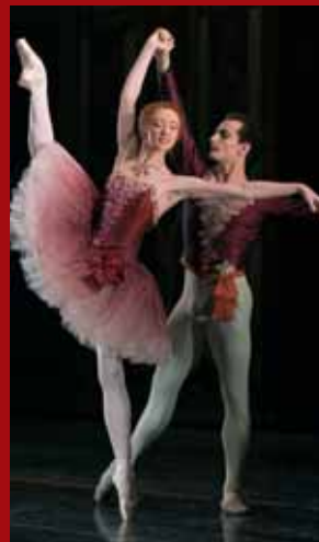
Semperoper Ballett „Der Nussknacker“